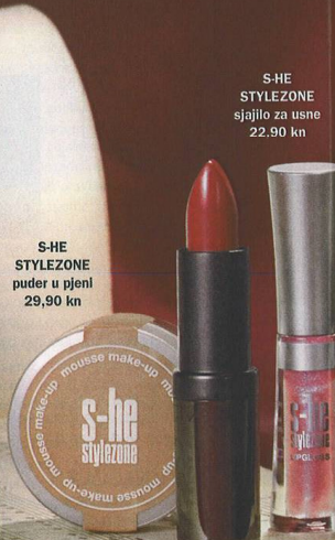
S-HE STYLEZONE puder u pjenu 29,90 kn